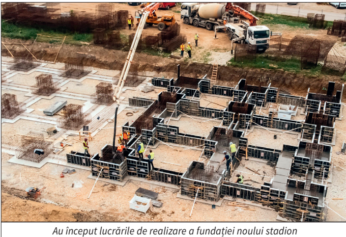
Au început lucrările de realizare a fundației noului stadion

Primul stadion construit în oraș, după 60 de ani