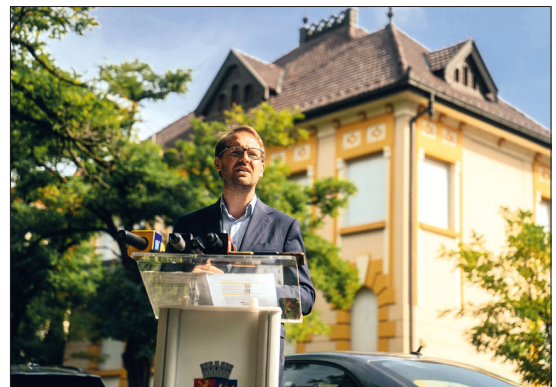
Vila istorică de pe bulevardul C. D. Loga 52 s-a reintors în patrimoniul orașului

„Bineînțeles că nu ne lăsăm șantajați și nici nu