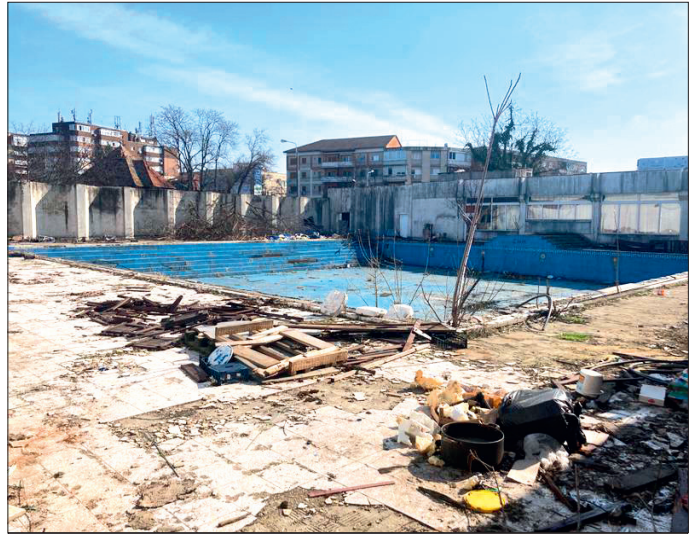
Aflat în stare avansată de degradare la preluare, ștrandul va fi modernizat de Horticultura

Recuperat în instanță de Primăria Timișoara, Ștrandul Termal. Acesta a fost preluat în administrare de societatea Horticultura și urmează să intre în reabilitare.