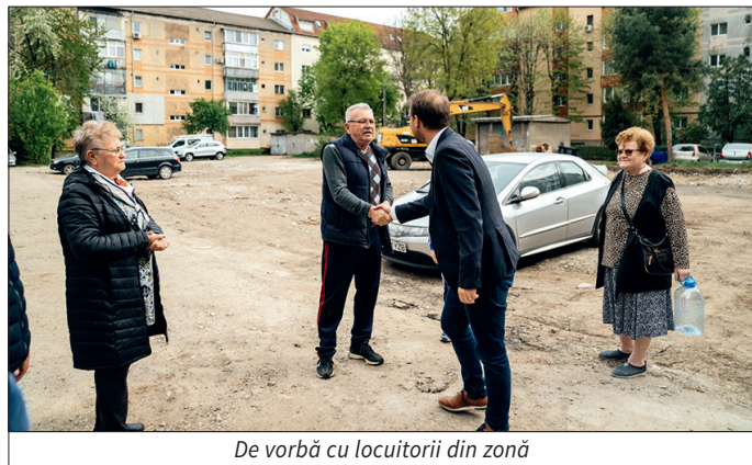
De vorbă cu locuitorii din zonă