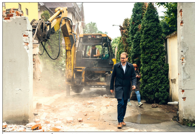
În timpul demolării construcțiilor ilegale

nu a avut curaj să pună piciorul în prag și să oprească aceste furturi din bunurile timișorenilor. Practic, în acest caz, clanurile au construit direct pe o stradă și au închis accesul timișorenilor pe aici, posibil la mica înțelegere cu fosta administrație locală. Strada publică a devenit curtea lor. Vremurile în care patrimoniul Timișoarei era prădat cu complicitatea administrației au trecut. Teren cu teren, vilă cu vilă recuperăm ce e al timișorenilor”, a declarat Dominic Fritz.