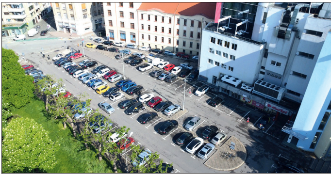
Actuala parcare din spatele Centrului Comercial Bega

Proiectul va contribui la suplimentarea numărului de locuri de parcare din centru, păstrând caracterul istoric al zonei. Investiția vizează reabilitarea și modernizarea spațiului public adiacent, crearea de noi spații verzi și pietonale, pentru ca locuitorii și vizitatorii orașului să se bucure de un mediu urban mai primitor. Parcarea va include, de asemenea, un parter înalt prevăzut pentru spații comerciale sau alte destinații viitoare. Sunt prevăzute și adăposturi pentru biciclete, iar accesul auto se va realiza de pe strada Carol Telbisz. Studiul de fezabilitate, proiectul tehnic și documentația pentru autorizarea lucrărilor de construire vor fi realizate de asocieria Norma Arhitectură și Urbanism SRL și Top Proiect SRL, pentru suma de 640.000 lei, cu TVA.