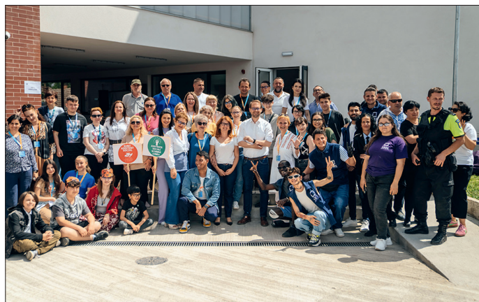
Fiecare a contribuit la reușita „Zilei porților deschise” de la Centrul Cultural și Educațional din Kuncz.

Prin intermediul centrului, comunitatea este încurajată să participe activ la viața publică. Aici vor avea loc în mod constant acți-