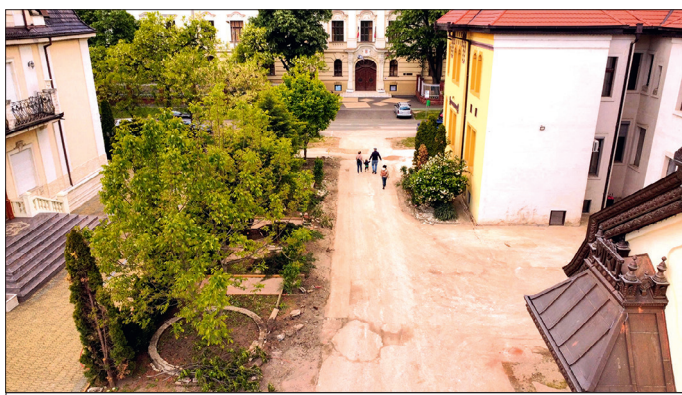
Strada este acum deschisă circulației

„Cu fiecare nou caz de recuperare a terenurilor orașului vedem dimensiunea halucinantă a acestei caracatițe, care a acaparat Timișoara timp de decenii. Este absolut revoltător faptul că nimeni