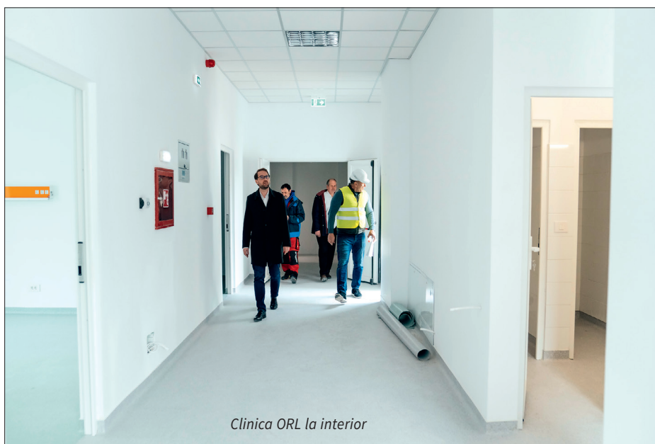
Clinica ORL la interior

Investiția are o valoare totală de 11,8 milioane de lei, cu TVA.