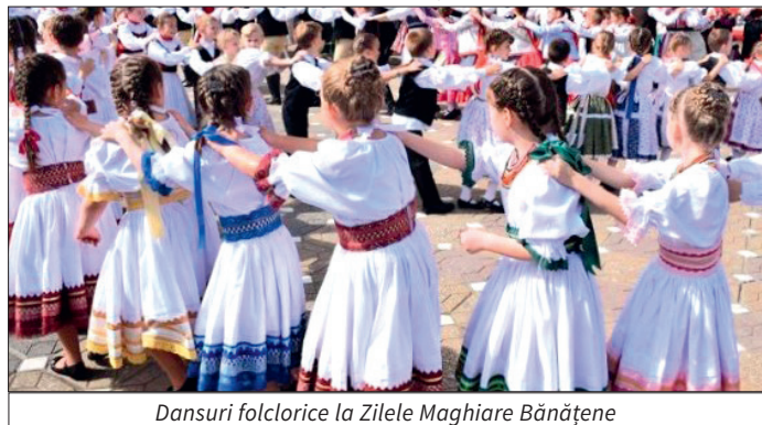
Dansuri folclorice la Zilele Maghiare Bănățene

Mai multe detalii despre activități și programul evenimentului pot fi găsite pe pagina de Facebook a Casei de Cultură a Municipiului Timișoara.