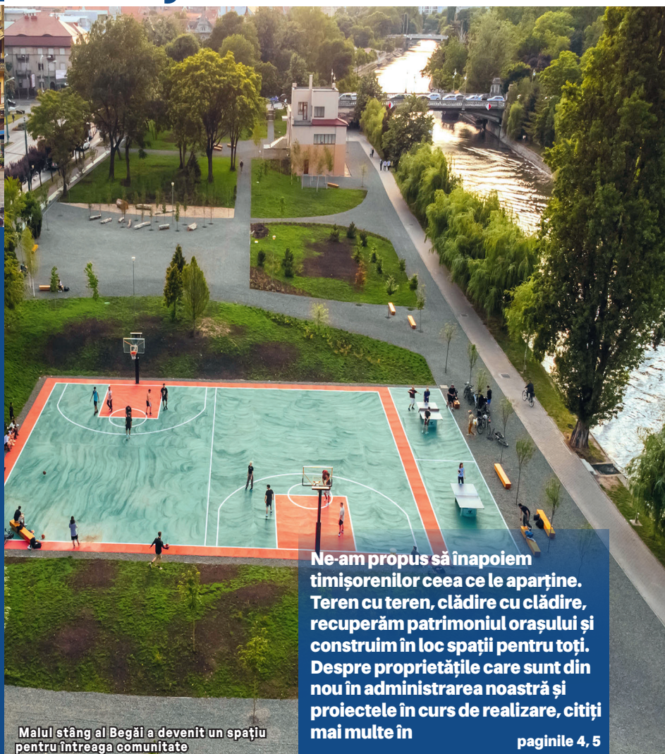
Malul stâng al Begăi a devenit un spațiu pentru întreaga comunitate

În Timișoara, continuarea investițiilor în dezvoltarea și întreținerea spațiilor publice de calitate va aduce beneficii pe termen lung, contribuind la creșterea calității vieții pentru toți locuitorii și la consolidarea identității orașului ca un centru cultural, economic și social prosper.