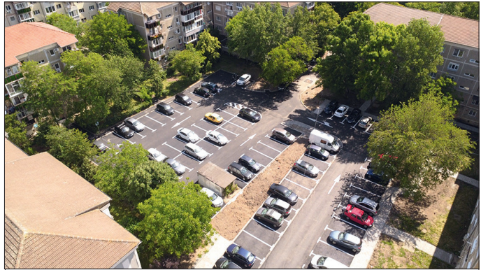
Noua parcare de pe strada Verde