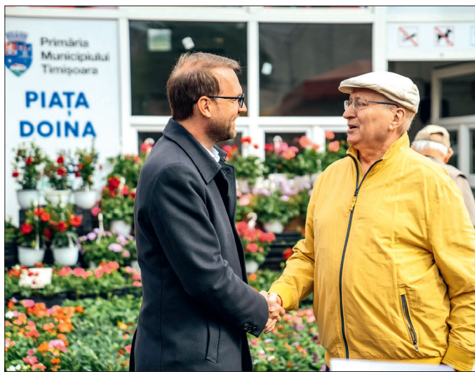
Primarul Timișoarei, de vorbă cu cumpărătorii din Piața Doina

Lucrările vor avea o valoare totală de aproximativ 2.000.000