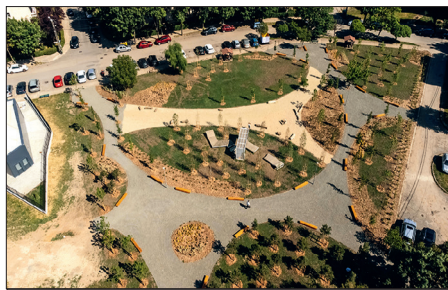
La amenajarea parcului s-au folosit numai materiale naturale

Timișorenii din zona Lunei se pot acum relaxa în cel mai nou parc din oraș. Realizat de Primărie în urma inițiativei cetățenilor, parcul invită la plimbare, pe aleile pietruite, sau la odihnă, pe băncile umbrite de cei peste 100 de arbori plantați.