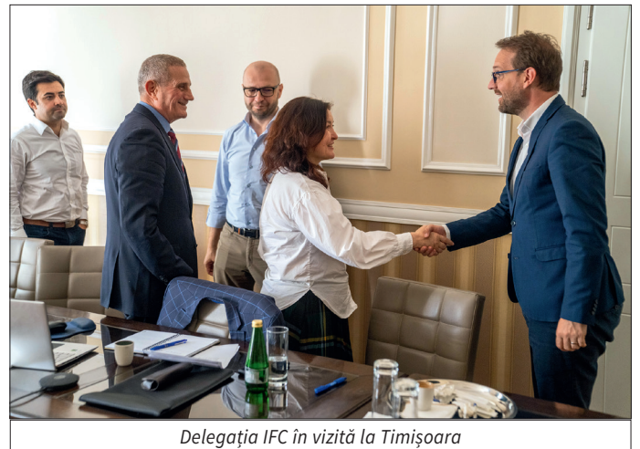
Delegația IFC în vizită la Timișoara

este inclus în prima etapă a acordului de asistență, alături de pregătirea studiului de fezabilitate și a studiului de fundamentare pentru parteneriatul public-privat.