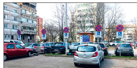
Persoanele cu dizabilități au acum la dispoziție 7 locuri de parcare

Cartierul Dacia din Timișoara este unul dintre cele mai aglomerate ale orașului. Zona este predominant una de blocuri și, implicit, suferă la capitolul locuri de parcare. Cu această problemă se confruntă și persoanele cu dizabilități care locuiesc pe strada Labirint. Pentru a veni în sprijinul lor, Comisia de Circulație din cadrul Primăriei Timișoara a răspuns solicitărilor și, în această primăvară, a creat două locuri noi de parcare destinate persoanelor cu dizabilități. Ele se adaugă celor cinci care existau deja pe această stradă.