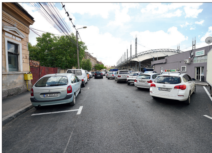
Locuri de parcare amenajate în spatele Pieței Badea Cârțan

„Am avut discuții și cu cei din piață, dar și cu cei care își fac cumpărăturile în mod frecvent în Badea Cârțan și am ajuns la câteva soluții pentru ca întreaga zonă să devină mai accesibilă tuturor. Este o zonă foarte tranzitată și tot timpul aglomerată și prin intervențiile pe care le facem acolo vrem să facilităm accesul timișorenilor în piață, fie că vin cu