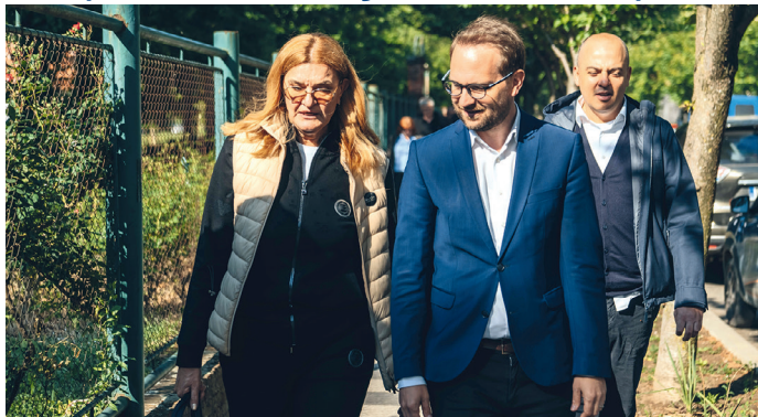
Elisabeta Lipă, președintă ANS și multiplă campioană olimpică de canotaj, împreună cu primarul orașului, Dominic Fritz

Primarul Dominic Fritz și Elisabeta Lipă, președinta Agenției Naționale pentru Sport, au dat vestea mult așteptată: secția de canotaj a CSM Timișoara va avea o casă nouă, modernă, pe malul Begăi. Baza sportivă a clubului va deveni centrul de pregătire al canotorilor, oferindu-le tot ce au nevoie pentru a excela. Deja au fost montate pontoane, iar restul amenajărilor vor urma în curând.