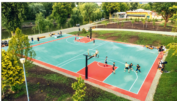
Tineri care joacă baschet, pe terenul proaspăt inaugurat

Recuperarea terenurilor ocupate ilegal continuă