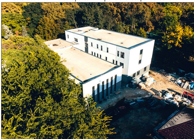
Timișorenii vor putea beneficia în curând de tratamente în condiții ultramoderne, la noua clinică

Valoarea totală a investiției este de 23,7 milioane de lei, cu TVA inclus.