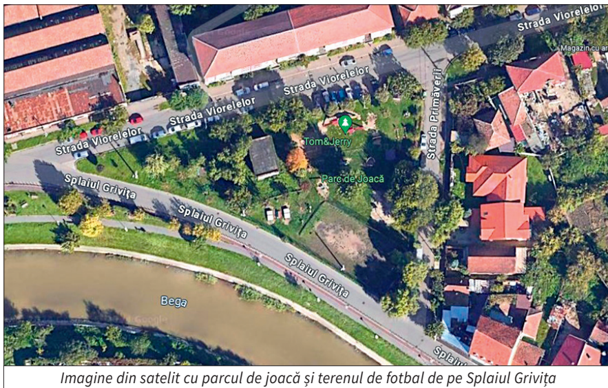
Imagine din satelit cu parcul de joacă și terenul de fotbal de pe Splaiul Grivița

Cetățenii au trimis nenumărate sesizări și solicitări pentru reabilitarea parcului Playground de pe Splaiul Grivița și a terenului de fotbal din vecinătate. Parcul a intrat acum în reamenajare, echipamentele vor fi rearanjate, iar sub ele se va monta covor de tartan, pentru a se evita accidentările și degradările. Vor fi aduse echipamente noi și se va repara gardul terenului de fotbal.