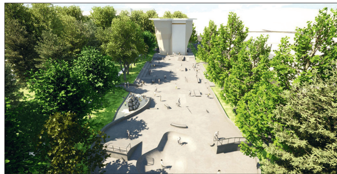
Așa va arăta noul skatepark din Timișoara

Documentația care stă la baza proiectului a obținut toate avizele necesare. Următoarea etapă este demararea licitației pentru lucrările de proiectare tehnică și execuție. Valoarea este de 15 milioane de lei, cu TVA, bani de la bugetul local, iar termenul de finalizare este de 12 luni de la începerea lucrărilor.