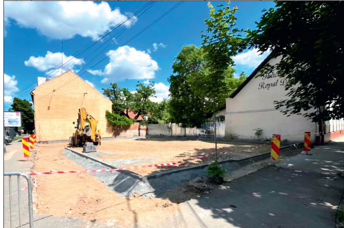
Primăria amenajează o parcare nouă, pe un teren public care a fost ocupat fără drept

Urmează să fie montate separatoarele de trafic și vor fi amenajate locuri de parcare în fața pieței, de o parte și de alta a liniei de tramvai.